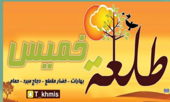
بهارات - خضار مشعل - دجاج مبرد - حمام T_khmis