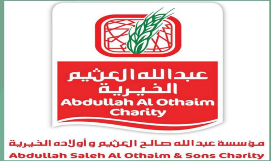
مؤسسة عبدالله صالح العثيم وأولاده الخيرية Abdullah Saleh Al Othaim & Sons Charity